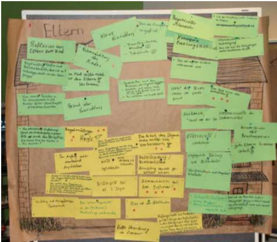
Plakat 1: Ergebnis der Kartenabfrage der Eltern

Hilfreich bewerteten die Eltern vor allem folgende Aspekte: